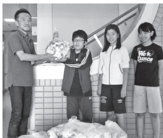
柳町小学校児童会生活委員会