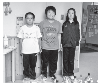
南中音更小学校児童会