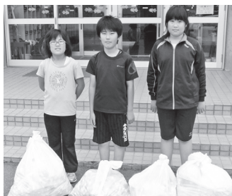
西中音更小学校児童会

当会では、皆様にご寄付いただいておりますペットボトルキャップ寄付受付の取り扱いを平成27年7月31日(金)をもちまして終了いたしました。