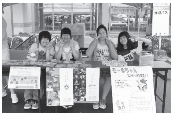
「会場で募金協力の呼びかけをしてくれた音更高校の皆様」

7月26日に開催した「福祉まつりinおとふけ2015」において、赤い羽根共同募金の協力の呼びかけを行った結果、多くの皆様の善意により16,039円の募金実績をあげることが出来ました。寄付者には北海道日本ハムファイターズやコンサドーレ札幌のグッズをそれぞれ進呈させていただきました。