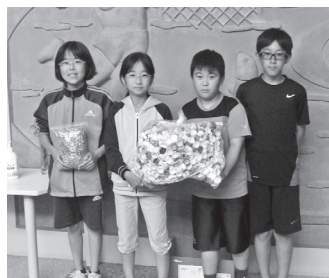
東土狩小学校児童会