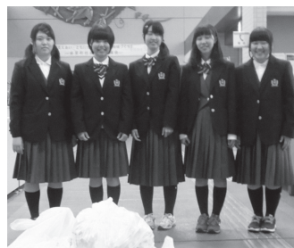
音更高校ボランティア同好会