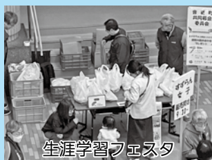
生涯学習フェスタ