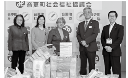
国際ソロプチミストおとふけ様