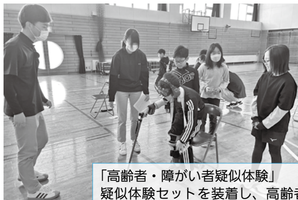
「高齢者・障がい者疑似体験」 疑似体験セットを装着し、高齢者や障がい者の身体機能を体験