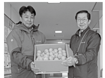
十勝川温泉観光協会様

匿名 (11件) 使用済切手 計183g+339枚 リングプル 計2.41kg ベルマーク 計174g