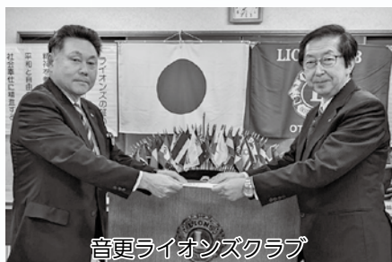
音更ライオンズクラブ