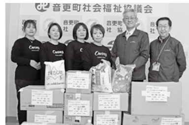
カーブスどんどん音更店様