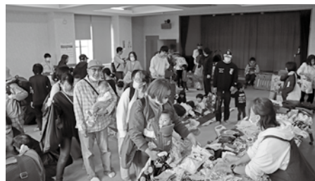
<子育てサロンくるみ おさがり品譲渡会>