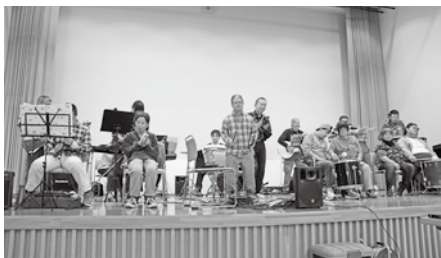
<つばさバンド 開幕演奏>