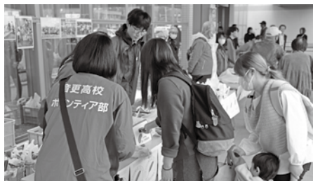
<共同募金特別企画>

当日は町内関係機関のご協力をいただきながら、つばさバンドによる開幕演奏、本会会長表彰・感謝状贈呈式、福祉映画の上映、介護用品の展示・体験、おさがり品譲渡会、赤い羽根共同募金特別企画などを実施しました。