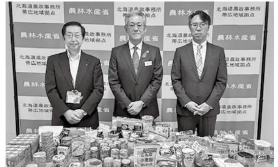
農林水産省 北海道農政事務所 帯広地域拠点様