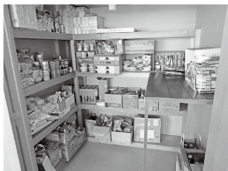
センター内で食料品等を保管しています