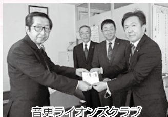
音更ライオンズクラブ