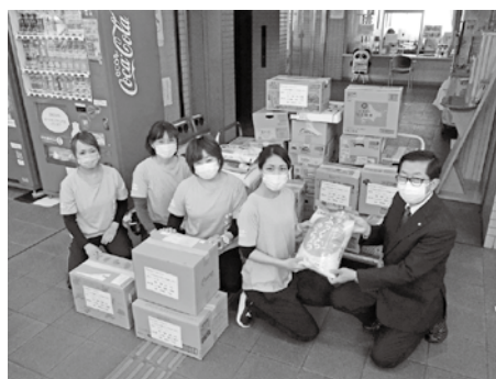
カーブスどんどん音更様より225kgの食料品をご提供いただきました！