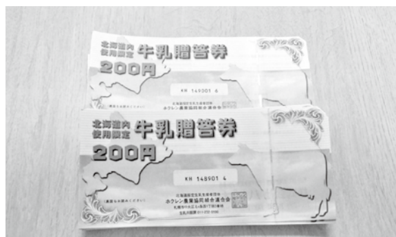
(公社) 帯広地方法人会音更地区会様より牛乳贈答券200枚をご提供いただきました！