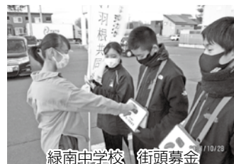
緑南中学校 街頭募金