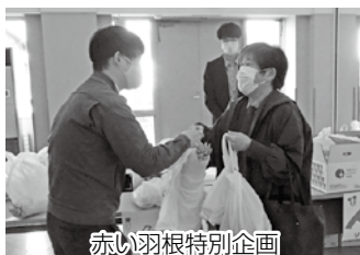
赤い羽根特別企画