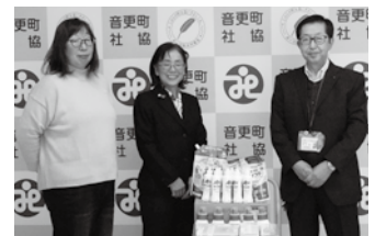
(JAおとふけ女性部様)