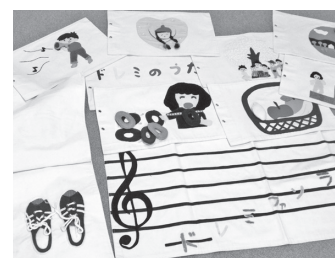
手づくりの布の絵本