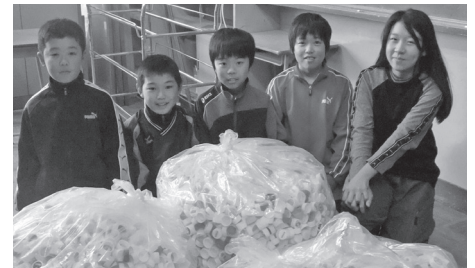
木野東小学校ボランティア委員会