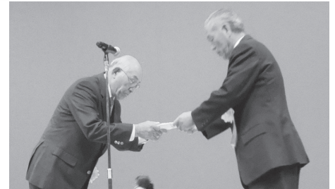
雄飛の館歌謡友の会