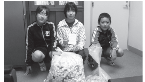
昭和小学校児童会