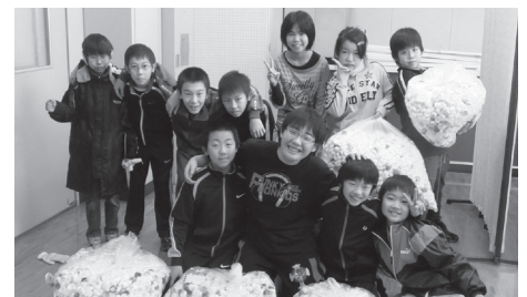
緑陽台小学校エコ委員会