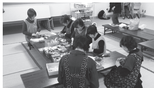
(手づくりおもちゃの製作風景)

音更町総合福祉センター 中集会室にて開催しています。(利用料無料) 今回は1月10日(木)の開催です。