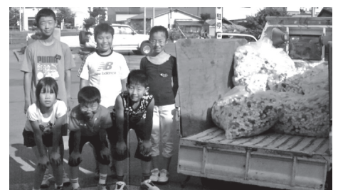
音更小学校児童会