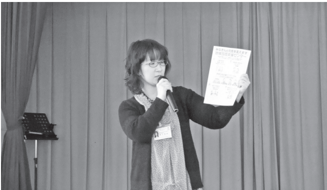
地域包括支援センター活動についての講演