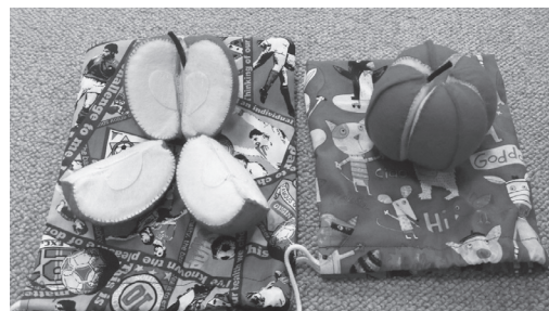
(ボランティア花風船の皆様が作成した 温かい布のおもちゃ)