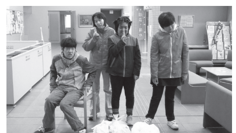
地域で一緒に暮らそう会