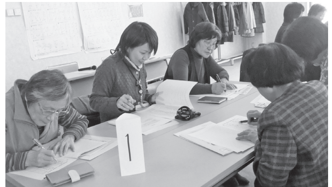
情報交換会では活発な意見交換がなされました